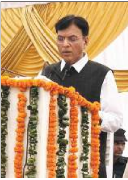
केंद्रीय स्वास्थ्य मंत्री चंडीगढ़-पंचकुला में एक कार्यक्रम को संबोधित करते हुए।